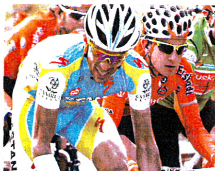
Contador et Samuel Sanchez seront dans le peloton, bien sûr