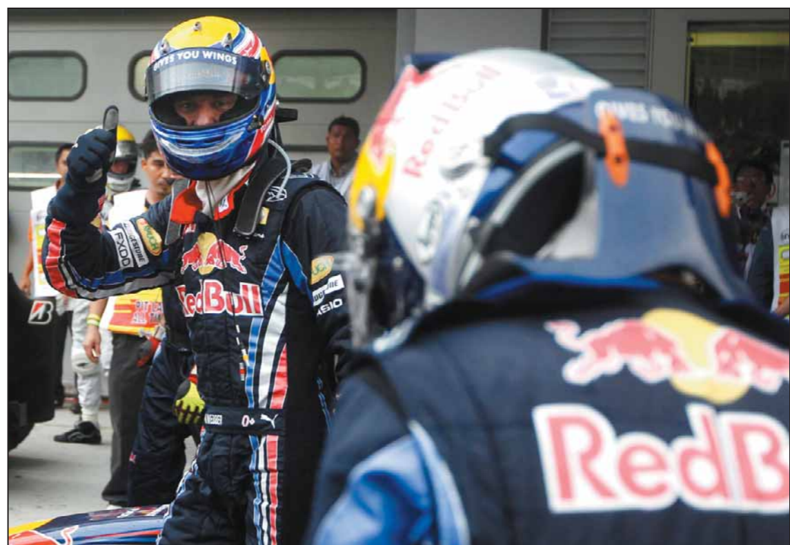
SEPANG, HIER. – Sébastien Vettel, de dos, avait signé les deux premières poles de la saison. Hier, Mark Webber, son équipier, n'était pas mécontent d'avoir renversé la tendance à son profit.

À condition de pouvoir enfin concrétiser, le dimanche, les résultats du samedi... « Nous continuons de tout faire pour nous placer dans les meilleures conditions pour la